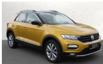
Autozentrum Blankenhain Hier kauft man die besten Fahrzeuge

Waldacker Str. 9 | 99444 Blankenhain Telefon: 036439 / 41888 E-Mail: info@az-blankenhain.de www.az-blankenhain.de