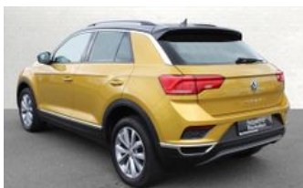
Autozentrum Blankenhain Hier kauft man die besten Fahrzeuge

Waldacker Str. 9 | 99444 Blankenhain Telefon: 036439 / 41888 E-Mail: info@az-blankenhain.de www.az-blankenhain.de