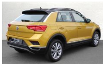
Autozentrum Blankenhain Hier kauft man die besten Fahrzeuge

Waldacker Str. 9 | 99444 Blankenhain Telefon: 036439 / 41888 E-Mail: info@az-blankenhain.de www.az-blankenhain.de