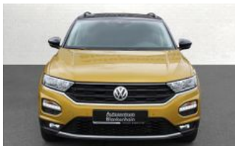
Autozentrum Blankenhain Hier kauft man die besten Fahrzeuge

Waldacker Str. 9 | 99444 Blankenhain Telefon: 036439 / 41888 E-Mail: info@az-blankenhain.de www.az-blankenhain.de