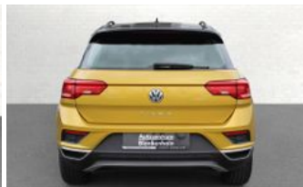
Autozentrum Blankenhain Hier kauft man die besten Fahrzeuge

Waldacker Str. 9 | 99444 Blankenhain Telefon: 036439 / 41888 E-Mail: info@az-blankenhain.de www.az-blankenhain.de