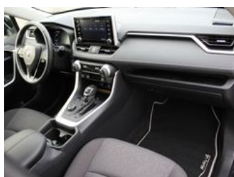
Autozentrum Blankenhain Blankenhain Hier kauft man Wissen