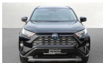
Autozentrum Blankenhain Blankenhain Hier kauft man Wissen