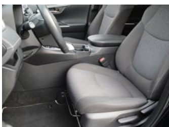
Autozentrum Blankenhain Blankenhain Hier kauft man Wissen