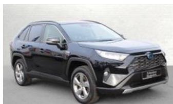
Autozentrum Blankenhain Blankenhain Hier kauft man Wissen