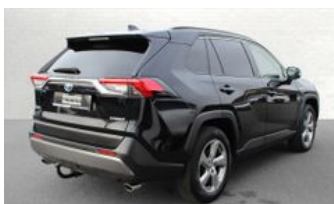
Autozentrum Blankenhain Blankenhain Hier kauft man Wissen