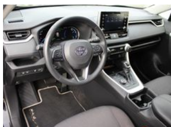
Autozentrum Blankenhain Blankenhain Hier kauft man Wissen