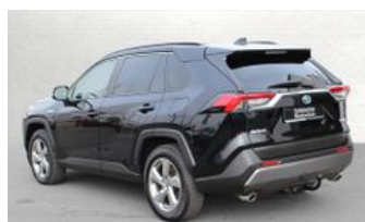
Autozentrum Blankenhain Blankenhain Hier kauft man Wissen