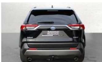
Autozentrum Blankenhain Blankenhain Hier kauft man Wissen