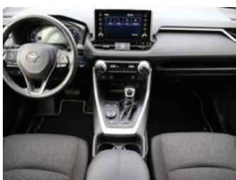
Autozentrum Blankenhain Blankenhain Hier kauft man Wissen