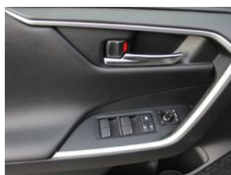
Autozentrum Blankenhain Blankenhain Hier kauft man Wissen