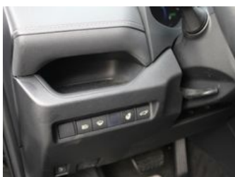
Autozentrum Blankenhain Blankenhain Hier kauft man Wissen