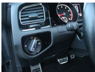
Autozentrum Blankenhain Hier kauft man Wissen