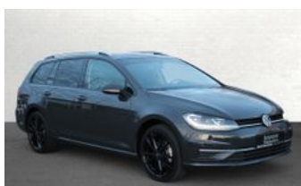
Autozentrum Blankenhain Hier kauft man Wissen