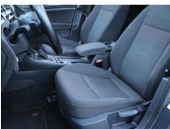
Autozentrum Blankenhain Hier kauft man Wissen