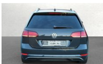
Autozentrum Blankenhain Hier kauft man Wissen