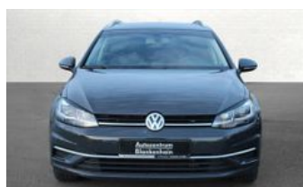
Autozentrum Blankenhain Hier kauft man Wissen