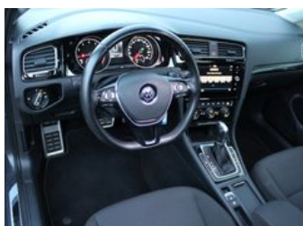
Autozentrum Blankenhain Hier kauft man Wissen