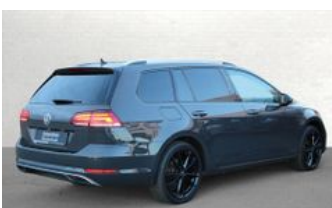
Autozentrum Blankenhain Hier kauft man Wissen