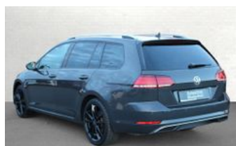
Autozentrum Blankenhain Hier kauft man Wissen