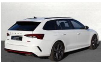
Autozentrum Blankenhain Waldecker Str. 9 | 99444 Blankenhain Telefon: 036439 / 41888 E-Mail: info@az-blankenhain.de www.az-blankenhain.de