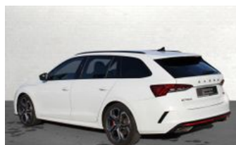
Autozentrum Blankenhain Waldecker Str. 9 | 99444 Blankenhain Telefon: 036439 / 41888 E-Mail: info@az-blankenhain.de www.az-blankenhain.de