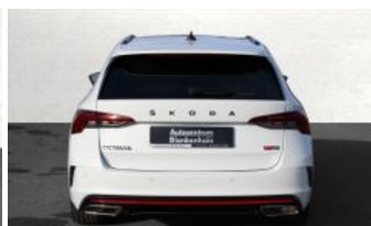
Autozentrum Blankenhain Waldecker Str. 9 | 99444 Blankenhain Telefon: 036439 / 41888 E-Mail: info@az-blankenhain.de www.az-blankenhain.de