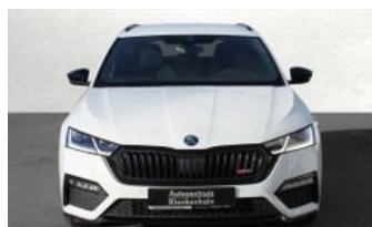
Autozentrum Blankenhain Waldecker Str. 9 | 99444 Blankenhain Telefon: 036439 / 41888 E-Mail: info@az-blankenhain.de www.az-blankenhain.de