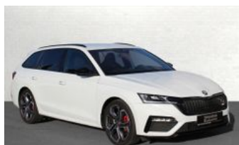
Autozentrum Blankenhain Waldecker Str. 9 | 99444 Blankenhain Telefon: 036439 / 41888 E-Mail: info@az-blankenhain.de www.az-blankenhain.de